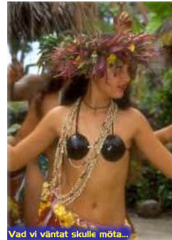
Vad vi väntat skulle möta...