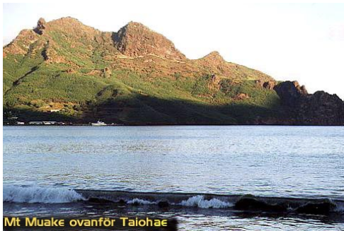
Mt Muake ovanför Taiohae

Ovanför Taiohae reser sig toppen av Mt. Muake – 864 m ö h. Inte så imponerande högt, men ändå en mäktig syn nere från bukten. Nuku Hiva har cirka 2000 invånare – varav huvuddelen bor i Taiohae, som är