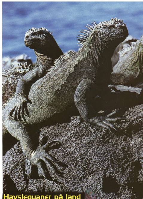
Havslequaner på land

Efter några timmar passerar vi "postboxön" Floreana och de förtrollade öarna försvinner sakta akterut.